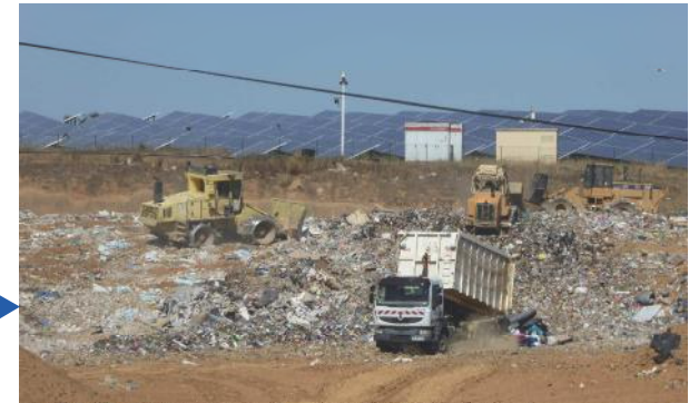
ISDND Saint-Jean de Libron (quartier Badones-Montimas)

La chambre régionale des comptes a révélé le scandale : l'usine Valorbi a coûté très cher et ne sert à rien !