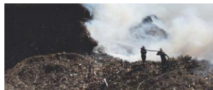
Incendie stockage déchets Sérignan, 29 août 2019