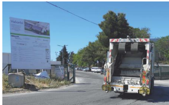
Centre de tri Valorbi (ex-UVOM) (route de Bédarieux)

A Béziers, la CABM traite les ordures ménagères non triées de 66 communes regroupant près de 200.000 habitants.